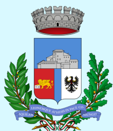
Comune di Calliano