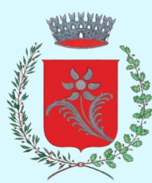
Comune di Nomi